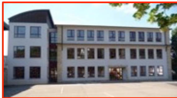
Cycle 4 Enseignement primaire

L'accueil des élèves des cycles 1 à 4 se fait dans les locaux de la Maison Relais à Bettendorf , du lundi au vendredi, de 7:00 à 7:45 heures . Ne sont pris en charge que les enfants bénéficiant des „chèques services“ et ayant été inscrits préalablement à la Maison Relais.