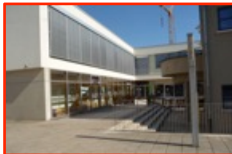
Cycle 1 Éducation préscolaire