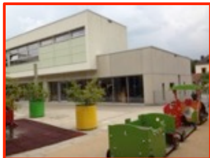
Cycle 1 Éducation précoce

Nouveaux numéros de téléphone dans tous les bâtiments à partir de la rentrée 2018/2019 !