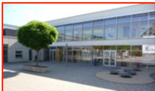
Cycles 2 et 3 Enseignement primaire